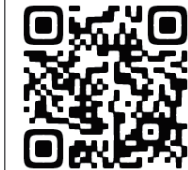
お申し込み用 二次元コード

接続できない場合はこちらのURLから https://forms.gle/QB5ApaGnrq9Zkz1WA