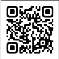
お申し込み用 二次元コード

②右の二次元コードから申し込む 入力フォームに接続しますので、必要事項を入力して送信してください。 接続できない場合はこちらの URL から https://forms.gle/QB5ApaGnrq9Zkz1WA