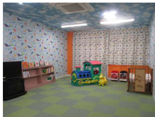
ぴゅあ峡南館内図